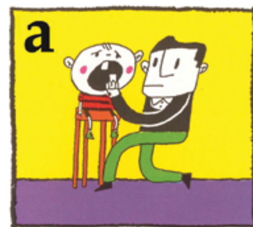
a Sett tannen tilbake på plass