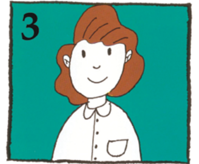
3 For at dette skal være mulig, oppsøk tannlege øyeblikkelig