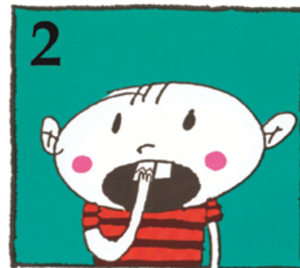
2 Biten kan limes tilbake