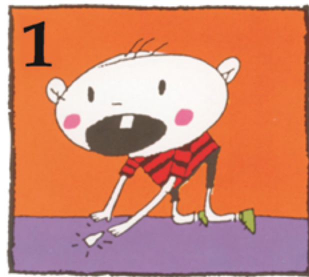
1 Finn tannen