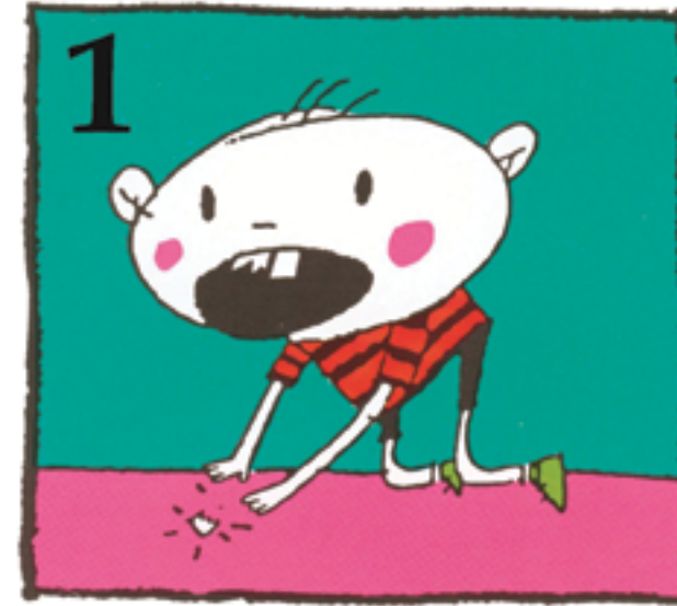
1 Finn tannbiten