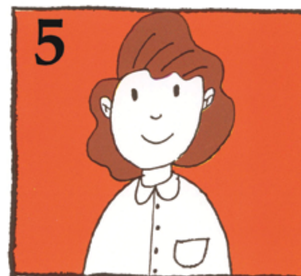
5 Søk øyeblikkelig hjelp hos tannlege