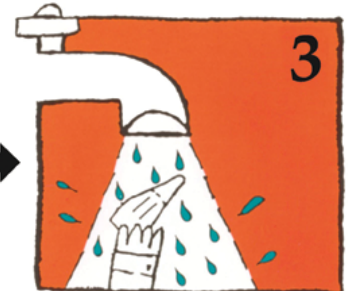
3 Skyll i kaldt vann fra kranen, eller rens den forsiktig i melk eller spytt