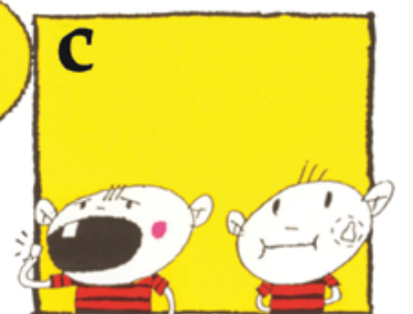
c Legg tannen i munnen mellom kinn og tannkjøtt, eller under tungen